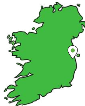
Uimhir 6, Sráid Fhearchair, Baile Átha Cliath 2.