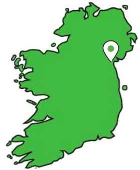
Áras Chonradh na Gaeilge, 5 Plás na Trá, Dún Dealgan, Co. Lú