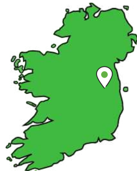
Áras Pobail Ráth Chairn, Ráth Chairn, Áth Búí, Co. na Mí.

Eagraítear ranganna Gaeilge do dhaltáí bun scoile, meánscoile, mic léinn ollscoile agus ranganna oíche agus deireadh seachtaine do dhaoine fásta chomh maith le campaí samhraidh do ghasúir áitiúla agus cúrsaí Gaeilge samhraidh do dhaltáí bun scoile agus meánscoile.