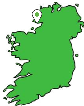
Áislann Chill Chartha, Cill Chartha, Co. Dún na nGall.