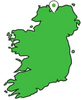
Cultúrlann Uí Chanáin, 37 Mórshráid Shéamais, Doire.